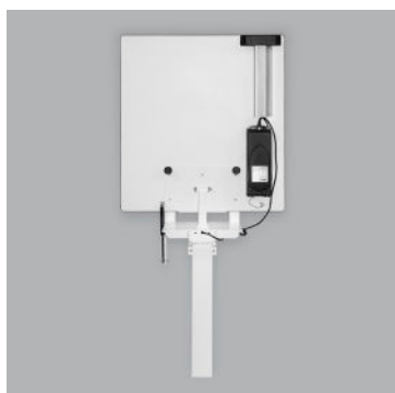
Bordplade vippet op.