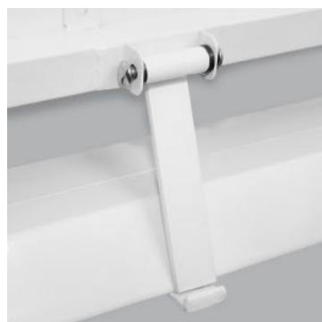
Sikkerheds låse mekanisme.